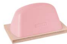
Rouge 54 Shore-00