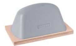
StarX 64 Shore-00 54 Shore-00 44 Shore-00 39 Shore-00