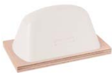
Longlife blanc 54 Shore-00 44 Shore-00

La gamme de tampons OrbiX comprend les qualités: