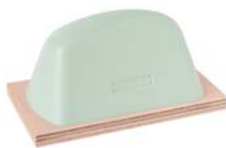
Vert 44 Shore-00