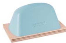
Bleu 64 Shore-00