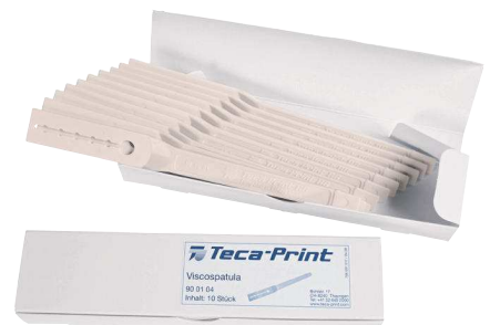
Paquet de 10 viscospatules numéro d'article: 90 01 04

Notez le temps d'écoulement qui correspond à de bonnes caractéristiques de traitement si vous devez réutiliser une encre. Ainsi, lors de votre prochain mélange, vous pourrez configurer directement la valeur optimale.